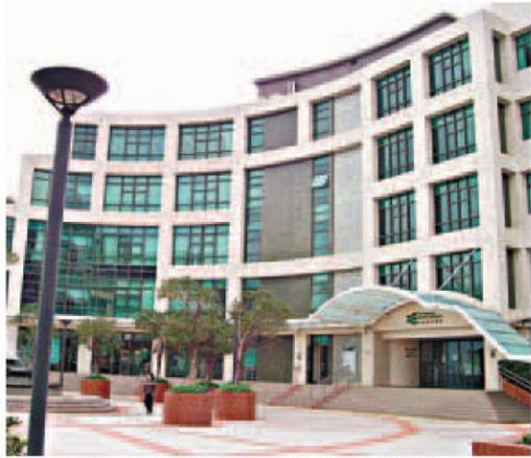
教育學院今年整體報讀中小PGDE課程的人數比去年微跌2%。資料圖片