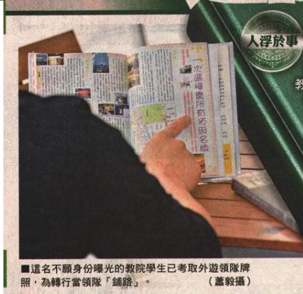
■這名不願身份曝光的教院學生已考取外遊領隊牌照，為轉行當領隊「鋪路」。

今年暑假料將有逾千名中小學準教師畢業，湧入正嚴重萎縮的教學市場，畢業隨時變失業。中一適齡童近年劇減，教育局急推中學減班及減派，但只顧保住現職超額老師，大批準教師面對寥寥可數的教席空缺入行無門。有自小立志執教鞭的準中學通識科老師，感前路茫茫，先後進修攝影、急救等多項證書課程作多手準備，更剛考得外遊領隊牌照，考慮轉行當外遊領隊。